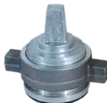
Hydra-Lock met vast