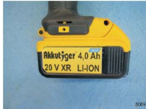
De super accu's (3 st. meegeleverd) Nieuwste XR LI-Ion technoloaie