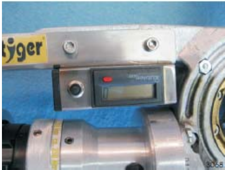
Elektronisch telwerk, optellend en aftellend, met resetknop