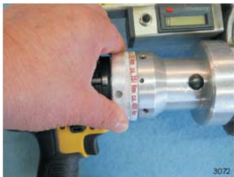
Gemakkelijk in te stellen slipkoppeling van ca. 50 - 600 Nm, direct afleesbaar.