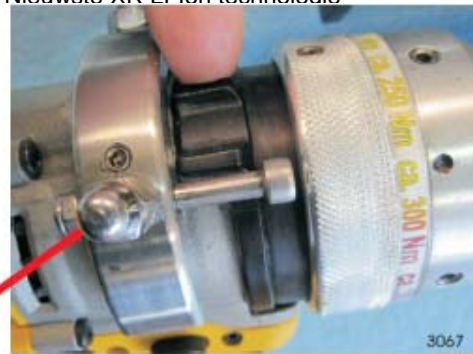
Ontgrendeling van de draaimomentbegrenzer voor reactiekrachten boven 600 Nm. (directe aandrijving zonder slipkoppeling). CE conform vergrendelingssteeem. Mag alleen met een sleutel ontgrendeld worden.

Elomat machines beperken het koppel met betrouwbare mechanische slipkoppelingen. Onze mechanische slipkoppelingen zijn tijdens het draaien instelbaar en onafhankelijk van het toerental!